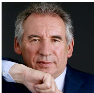
Presidente François Bayrou

Il Partito Democratico Europeo, fondato da François Bayrou e Francesco Rutelli nel 2004, è un partito politico europeo centrista che riunisce i partiti politici e gli eurodeputati che desiderano un'Unione più vicina ai propri cittadini. In quanto movimento politico transnazionale, il PDE intende costruire una democrazia europea fondata sui valori condivisi di pace, libertà, solidarietà e istruzione, con l'ambizione di affermare con orgoglio la propria cultura nel mondo futuro.