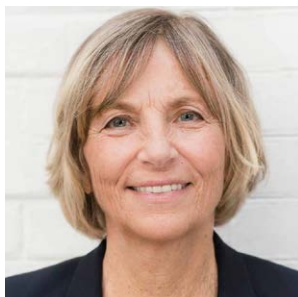
Segretario generale Marielle de Sarnez