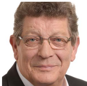
Delegato generale Gérard Deprez